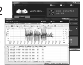
※画面はイメージです。

G-MENの条件設定や データ処理などを 簡単に行うアプリケーションです。 (対応OS:Windows10・11)